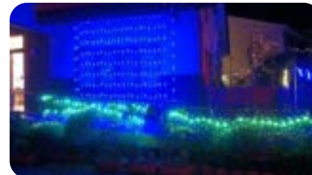
湖山町の観光名所になったらうれしいなあ

毎日夕方5時前から夜9時ごろまでピカピカしております。公民館の壁面にプロジェクションマッピング風に動くタイプもありますので、なにがうつしだされているのか楽しみにごらんください。湖山地区公民館のホームページには、動画も掲載しております。